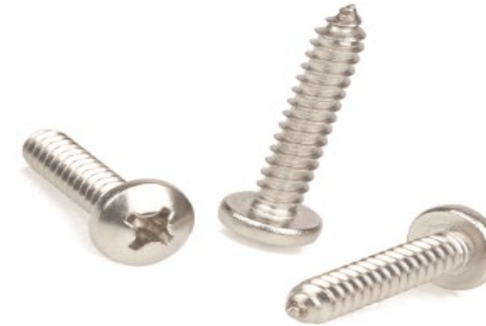
d) Type H — Cross recess